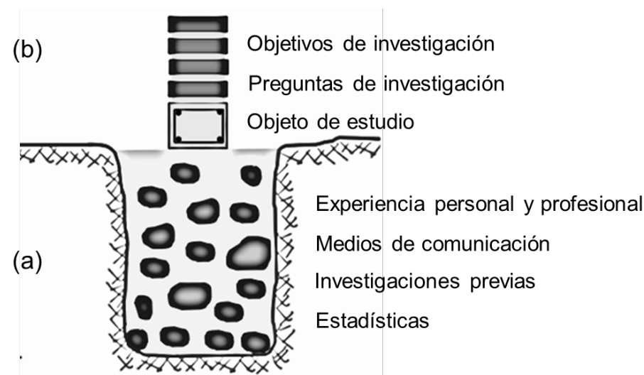
Figura 1. Situación problemática (a), cimientación de la tesis (b).