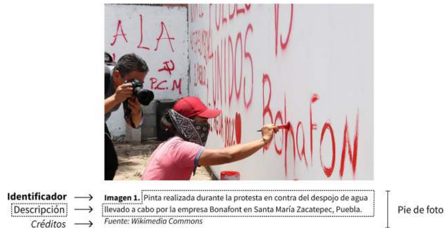
Figura 5. Ejemplo de pie de foto en el que señala el identificador, la descripción y los créditos.

descripciones breves relacionadas con la escena fotografiada 9 o interpretaciones breves de la fotografía. Otro aspecto importante que siempre deberá contener el pie de foto es el crédito de la persona que tomó la fotografía o del fondo documental donde fue obtenida.