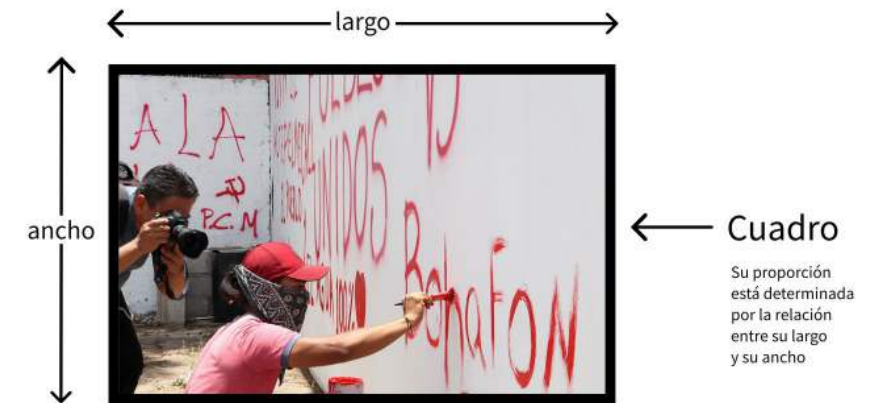
Figura 1. Fotografía en la que se ha remarcado el cuadro. En este ejemplo el fotógrafo seleccionó de su entorno fragmentos de dos personas que realizan actividades diferentes (fotografiar y pintar un muro).

Este registro visual implica que la persona seleccione lo que quiere fotografiar en un formato delimitado por el “cuadro”, un rectángulo con una proporción determinada (Ver figura 1) y que accione el dispositivo que registrará la imagen en una superficie sensible a la luz. En este punto se identifica una primera determinación arbitraria; el formato del cuadro con una forma geométrica específica.