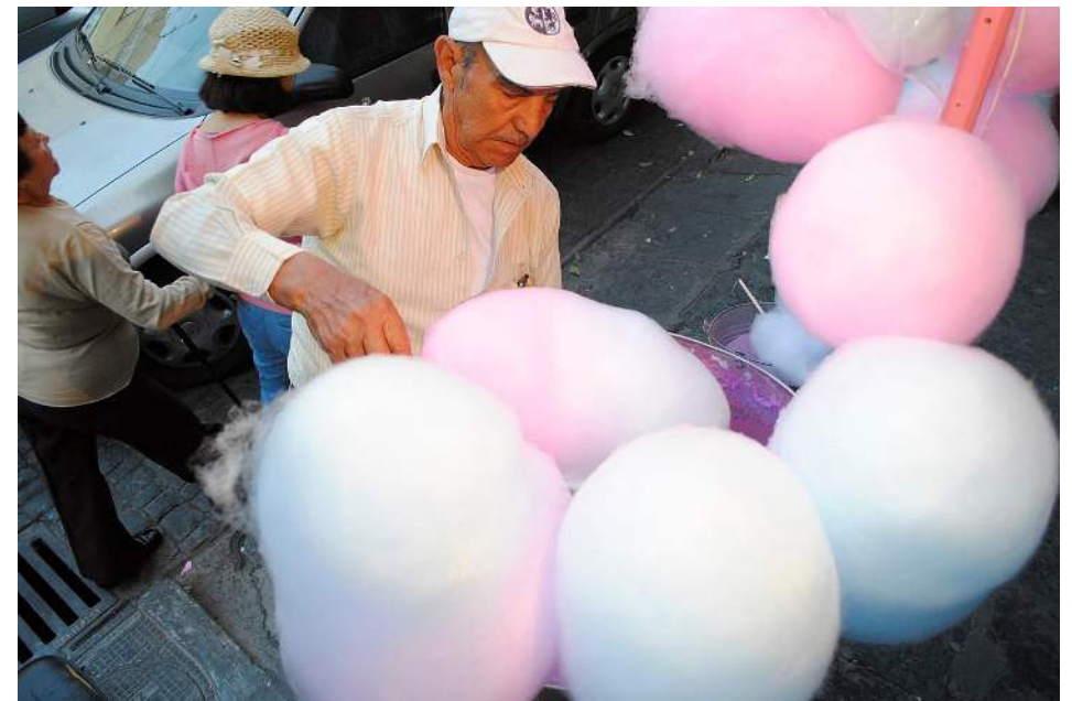
Figura 4. Una angulación picada suele representar a los sujetos de una forma más vulnerable pero también puede explicar al receptor una situación espacial. En esta fotografía con angulación picada, se identifica que el sujeto principal está situado en una banqueta, rodeado frontalmente por algodones de azúcar y detrás de él caminan dos personas.

Por el contrario, cuando la cámara se ubica por debajo del sujeto y se inclina hacia arriba se denomina “contrapicado”, esta inclinación permite que el sujeto sea captado desde una posición inferior, lo que le otorga al punto de interés un efecto de superioridad. Cuando la cámara se coloca a la misma altura del sujeto representado, para el caso de las personas a la altura de sus ojos, se denomina angulación normal o neutra.