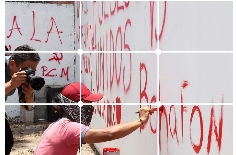
Figura 2. En esta imagen el fotógrafo aplicó la regla de los tercios para determinar la posición del sujeto principal de la composición cuya cabeza coincide con el punto inferior izquierdo de la rejilla.

La regla de los tercios señala que, para otorgarle importancia al sujeto, éste debe posicionarse en uno de los “puntos fuertes” donde se cruzan las líneas. Si el sujeto tiene una forma alargada —vertical u horizontal— éste debería situarse sobre una de las líneas. En la Figura 2 se observa la rejilla en color blanco y se identifica que la cabeza del sujeto principal de la composición se encuentra en uno de los puntos fuertes.