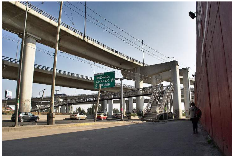
Figura 3. A pesar de la presencia de líneas verticales (columnas y postes) en esta fotografía dominan las líneas diagonales (puentes, muro, banqueta y sombra) que otorgan profundidad a la composición.

Las principales líneas usadas en composición fotográfica son; horizontales, que pueden servir de base para la composición y transmiten estabilidad; verticales, que pueden expresar fuerza y poder; la diagonales que pueden expresar dirección —como en el caso de la perspectiva—; y las curvas que pueden resultar atractivas para la mayoría de receptores.