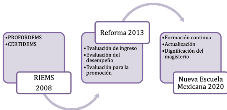
Figura 4.1. El recorrido de las Reformas