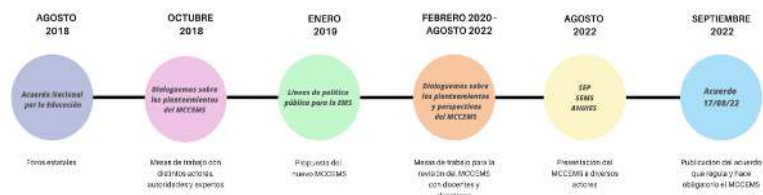
Figura 4.2. Proceso de conformación del MCCEMS