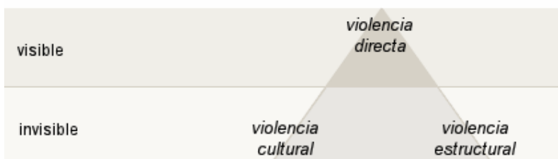
Figura 1. Triángulo de la violencia de Galtung

La Organización Panamericana de la Salud ha propuesto una clasificación según los agentes involucrados y la naturaleza del acto violento: